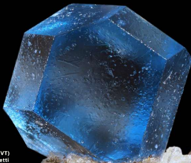
Häuyna - 1,5 mm - Onano (VT) Coll. A. Bar