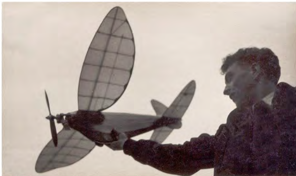
La passione per il volo